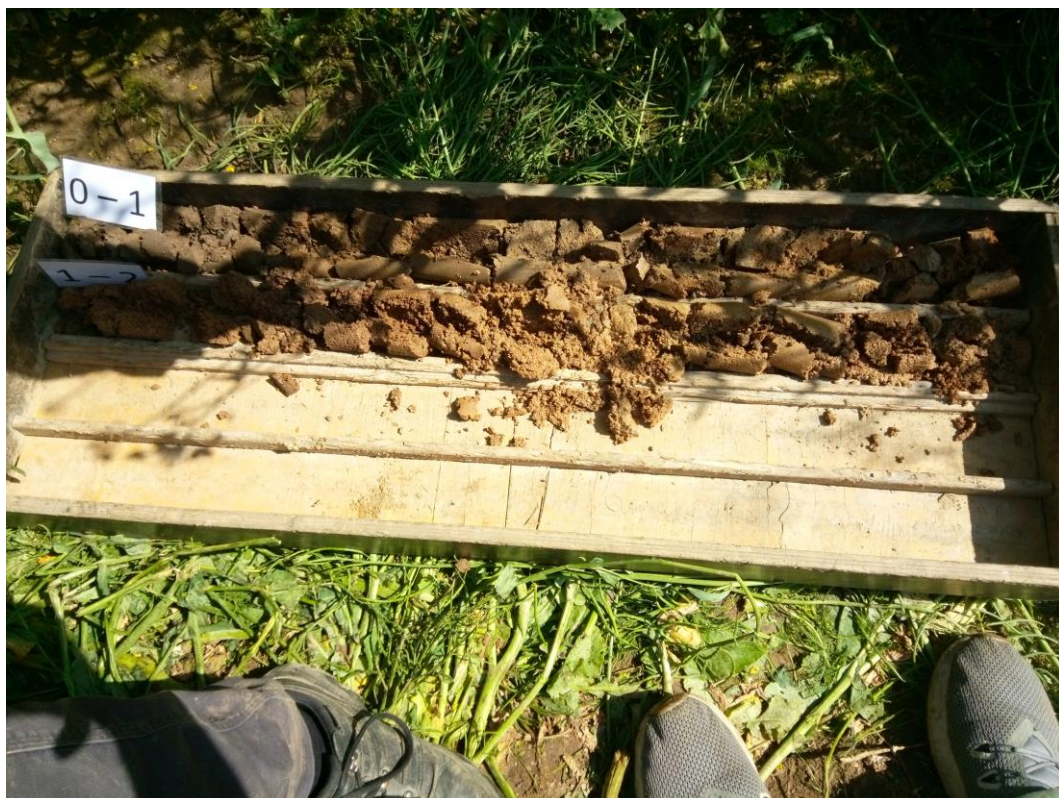
Obrázek 2: Jádro získané ze zarážené sondy ZS2 na lokalitě Borovnice