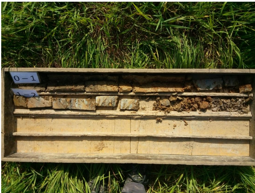
Obrázek 1: Jádro získané ze zarážené sondy ZS1 na lokalitě Borovnice