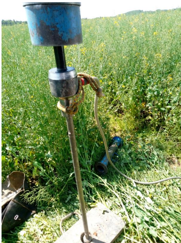
Obrázky 3 a 4: Realizace sond ZS1 a ZS2 na lokalitě Borovnice